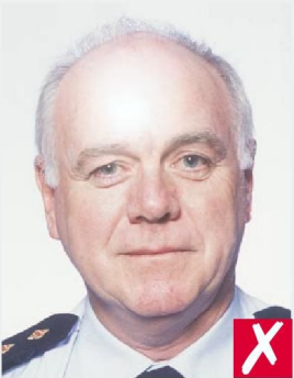
ОТРАЖЕНИЕ ВСПЫШКИ НА КОЖЕ/ FLASH REFLECTION ON SKIN