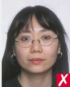
ОПРАВКА ЗАКРЫВАЕТ ГЛАЗА/ FRAMES COVERING EYES