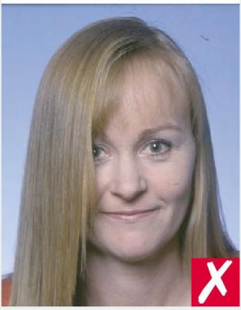
ВОЛОСЫ ЗАКРЫВАЮТ ГЛАЗА/ HAIR ACROSS EYES

■ освещение должно быть равномерным и не допускать появления тени или отражения вспышки на лице, а также, исключать появление эффекта красных глаз/ be taken with uniform lighting and not show shadows or flash reflections on your face and no red eye