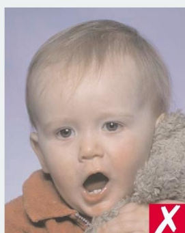
ОТКРЫТ РОТ И ИГРУШКА СЛИШКОМ БЛИЗКО К ЛИЦУ/ MOUTH OPEN AND TOY TOO CLOSE TO FACE