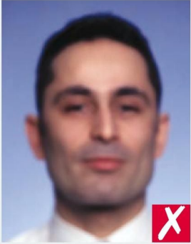
ИЗОБРАЖЕНИЕ РАЗМЫТО/ BLURRED