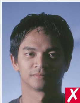
ТЕНЬ НА ЛИЦЕ/ SHADOWS ACROSS FACE