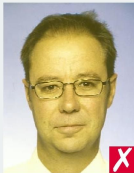
НЕЕСТЕСТВЕННЫЙ ТОН КОЖИ/ UNNATURAL SKIN TONES