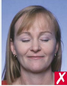
ЗАКРЫТЫ ГЛАЗА/ EYES CLOSED