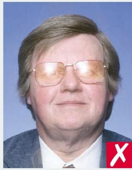
ОТРАЖЕНИЕ ВСПЫШКИ НА ЛИНЗАХ/ FLASH REFLECTION ON LENSES