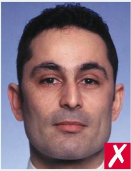
СЛИШКОМ БЛИЗКО/ TOO CLOSE

Фотографии, снятые с помощью цифрового фотоаппарата, должны быть высококачественными и цветными, а также, напечатаны на фотобумаге/ Photographs taken with a digital camera must be high quality colour and printed on photo-quality paper.