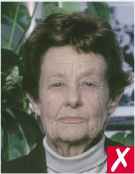
НЕ ОДНОТОННЫЙ ФОН/ BUSY BACKGROUND