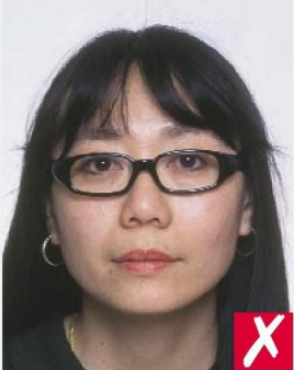
СЛИШКОМ МАССИВНАЯ ОПРАВКА/ FRAMES TOO HEAVY