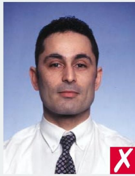
СЛИШКОМ ДАЛЕКО/ TOO FAR AWAY