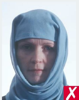
ТЕНЬ НА ЛИЦЕ/ SHADOWS ACROSS FACE