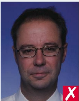
СЛИШКОМ ТЕМНАЯ/ TOO DARK