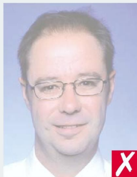
СЛИШКОМ СВЕТЛАЯ/ TOO LIGHT