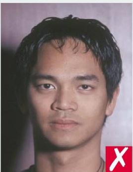
ТЕНЬ ЗА ГОЛОВОЙ/ SHADOWS BEHIND HEAD