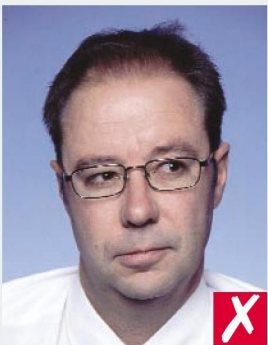
ВЗГЛЯД В СТОРОНУ/ LOOKING AWAY