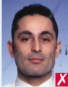
СЛЕДЫ ЧЕРНИЛ / ЗАГИБА/ INK MARKED / CREASED