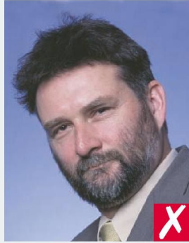
ГЛАЗА НЕ НА ОДНОМ УРОВНЕ (ГОЛОВА НАКЛОНЕНА)/ EYES TILTED