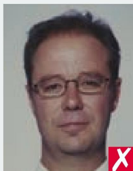
ВИДНЫ ПИКСЕЛИ/ PIXELATED