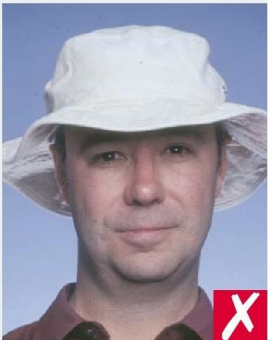
ГОЛОВНОЙ УБОР - ШЛЯПА/ WEARING A HAT