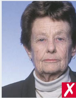
НЕ ПО ЦЕНТРУ/ NOT CENTRED