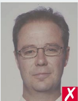
ТУСКЛЫЕ КРАСКИ/ WASHED OUT COLOUR