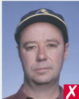
ГОЛОВНОЙ УБОР - КЕПКА/ WEARING A CAP