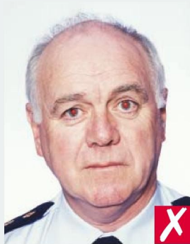
ЭФФЕКТ КРАСНЫХ ГЛАЗ/ REDEYE