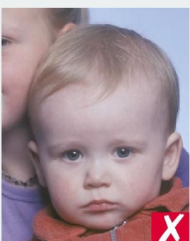
В КАДРЕ ВТОРОЙ ЧЕЛОВЕК/ SHOWS ANOTHER PERSON