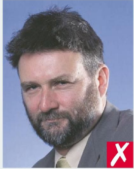
ПОРТРЕТНЫЙ СТИЛЬ (ПОЛУБОРОТОМ)/ PORTRAIT STYLE