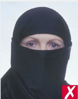
ЗАКРЫТО ЛИЦО/ FACE COVERED