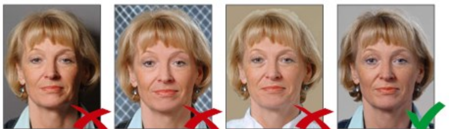
Đổ bóng phía sau Hình nền gây nhiễu Nền không có độ tương phản